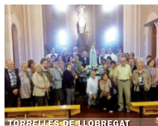
TORRELLES DE LLOBREGAT