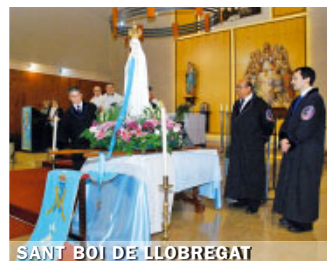
SANT BOI DE LLOBREGAT