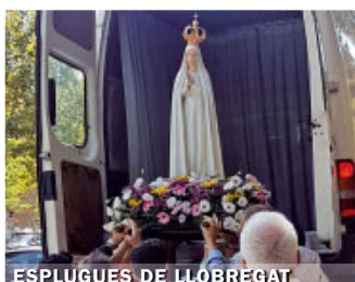
ESPLUGUES DE LLOBREGAT