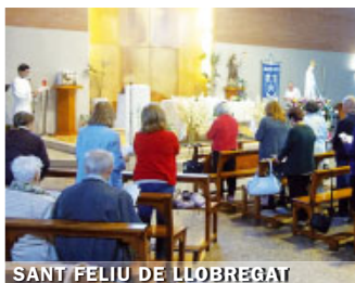
SANT FELIU DE LLOBREGAT

Una joia ha estat veure la mobilització de tantes persones a Castelldefels , gairebé prop d'un miler en conjunt. La processó des de l'església de Montserrat fins a la Parròquia de Santa Maria va iniciar-se amb mitja hora de retard perquè la policia local no havia previst tanta participació ciutadana i va haver de demanar reforços. A més de molts fidels, van involucrar-se en els diversos actes el coro rociero «Blanca Paloma», l'agrupació musical de la Hermandad del Santo Cristo de la Paz, el grup de Pastoral de la Salut i el de la renovació carismàtica.