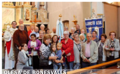
OLESA DE BONESVALLS