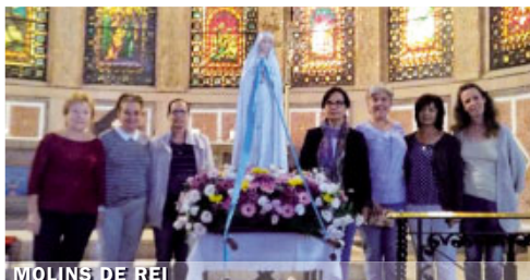
MOLINS DE REI