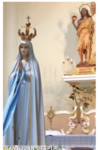
SANT JOAN DESPÍ