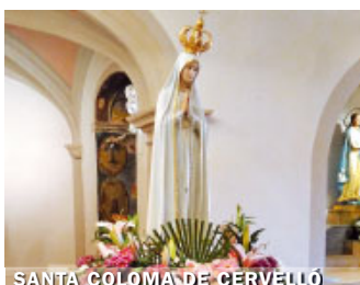
SANTA COLOMA DE CERVELLÓ