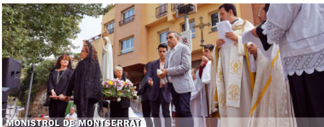
MONISTROL DE MONTSERRAT